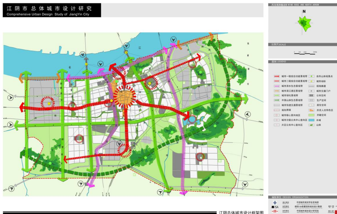
总体城市设计框架图