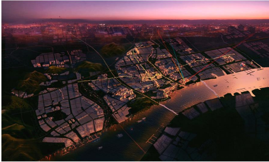
江阴市总体城市设计鸟瞰图